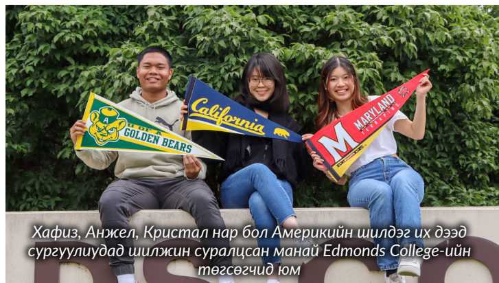
Хафиз, Анжел, Кристал нар бол Америкийн шилдэг их дээд сургуулиудад шилжин суралцсан манай Edmonds College-ийн төгсөгчид юм