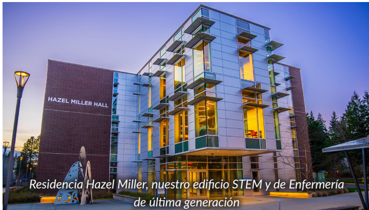
Residencia Hazel Miller, nuestro edificio STEM y de Enfermería de última generación

Escanee este código QR para acceder a nuestra página web, un recorrido por el campus, testimonios, recursos y más.