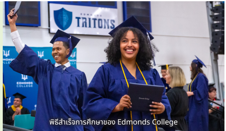
พิธีสำเร็จการศึกษาของ Edmonds College